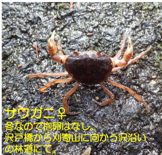
サワガニ♀ 冬なので抱卵はなし。 沢戸橋から刈寄山に向かう沢沿いの林道にて。