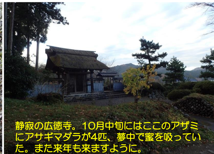
静寂の広徳寺。10月中旬にはこのアザミにアサギマダラが4匹、夢中で蜜を吸っていた。また来年も来ますように。