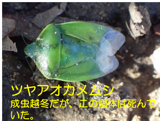
ツヤアオカメムシ 成虫越冬だが、この個体は死んでいた。