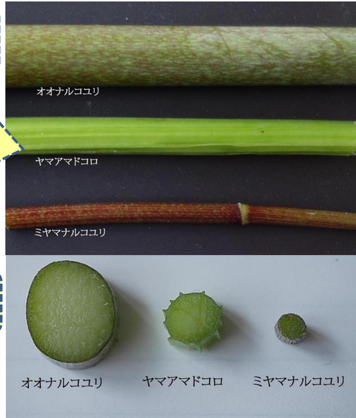
オオナルコユリ ヤマアマドコロ ミヤマナルコユリ